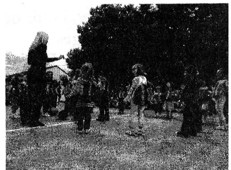
Kermesse de fin d'année

Les bénéfices de ces initiatives ont permis l'achat de matériel ainsi que le financement de sorties pour les classes du RPI.