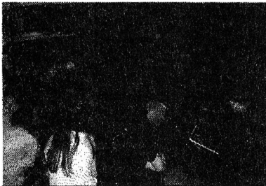
Participation à la soirée Halloween organisée par l'association La Bouquinette